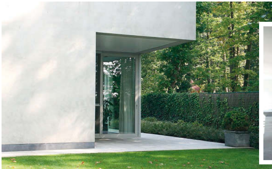
Villa C in Wingene: "Doorzonruimtes, ingebed in het groen, verdiepingshoge ramen, ruime oversteken en diepe perspectieven vormen de basiselementen van deze gelijkvloerse villa. Het licht doet de rest"

Geen beter voorbeeld van hun aanpak dan de uitbreiding van de eigen woning. Er is het oude en het nieuwe gedeelte. Over dit stuk architecturale 'breiwerk' werd er goed nagedacht. Zo werd de inname van de site optimaal benut. Het geluk wil dat de woning niet pal in het midden van het perceel stond, zodat de uitbreiding de tuin vandaag op een zachte manier omarmt. Omdat de woning op een hoek ligt, was het perfect mogelijk om privé en bureau van elkaar te scheiden. Het kantoor heeft een aparte inkom, net zoals de woning. Momenteel is die nog niet helemaal af. Het architectenkoppel is nog een aantrekkelijke tuinoplossing aan het bedenken en bestudeert hoe ze het kleine lapje groen tussen voordeur en straat op een interessante manier zullen aanleggen. Het getuigt in elk geval van een gezond wikken en wegen, want keuzes kunnen inderdaad verscheurend zijn. □