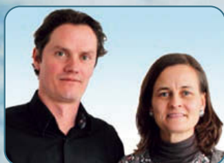
arch. Lorenzo Kemel & arch. Annelies Vancraeyveldt AR-tuur architectenbureau bvba

“ARCHITECTUUR IS KWESTIE VAN RUIMTE EN GRENZEN”