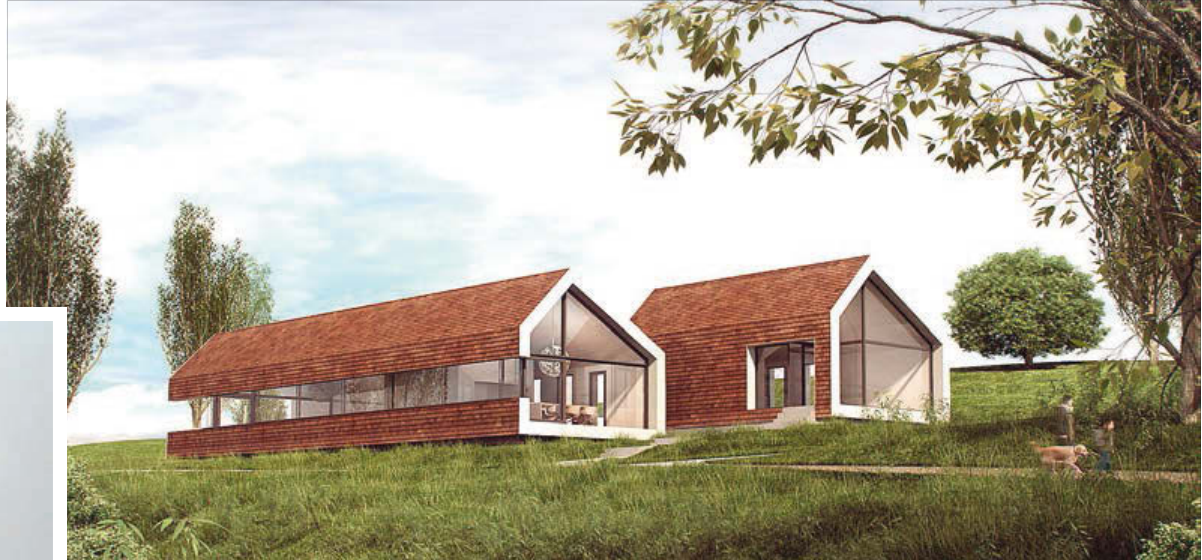
Villa in Melden: "De prominent aanwezige volumes op de heuvel herbergen de leefruimtes, terwijl de semiondergrondse slaapruides de geborgenheid van de natuurlijke helling opzoeken"