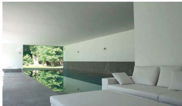
"Het raam juist boven het wateroppervlak geeft het zwemgebeuren een extra dimensie"