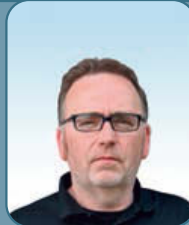
arch. Eduard Maes Architectenbureau TEMAS p. 14